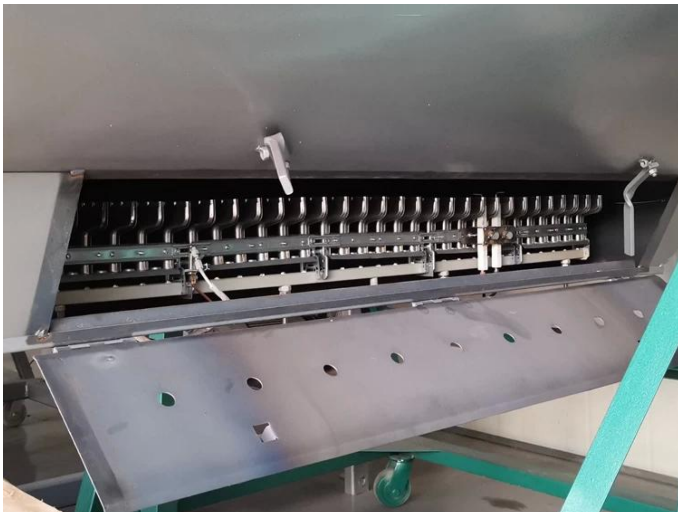
Peloton de feu à combustion en forme de T couvrant le canon de fixation du thé, zone de combustion jusqu'à 100%.